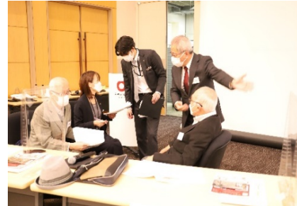
進行、最後の確認です