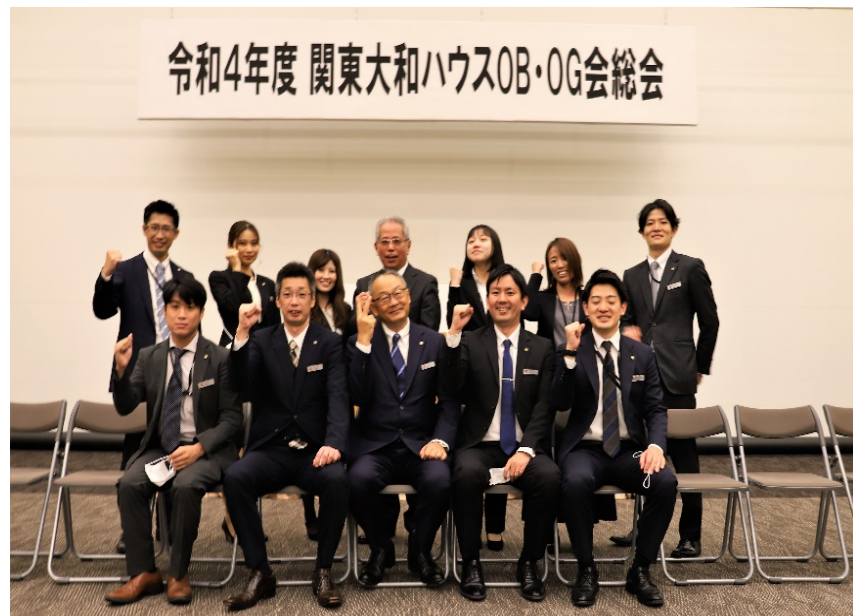
裏方で活躍された総務・人事部の皆さん。ありがとうございました♥