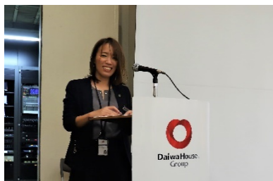
総司会、お疲れ様です。