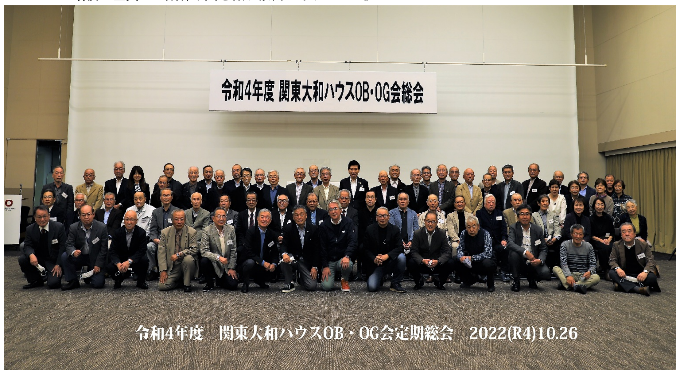
令和4年度 関東大和ハウスOB・OG会定期総会 2022(R4)10.26