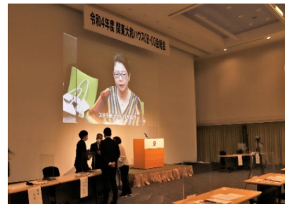
早めに来られた会員の方にセミナー委員会の対談セミナー動画でおもてなし？