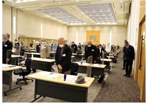
(在天の星となられた物故会員への黙禱)