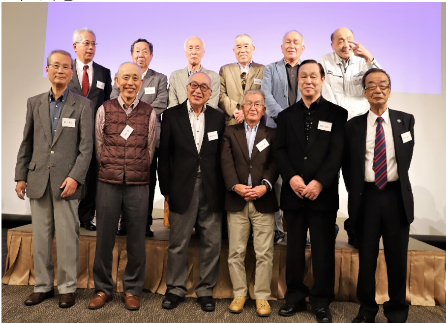
(バリバリの笑顔が素敵な喜寿の皆さん)