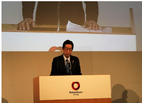
大和ハウスライフサポート(株) 東社長